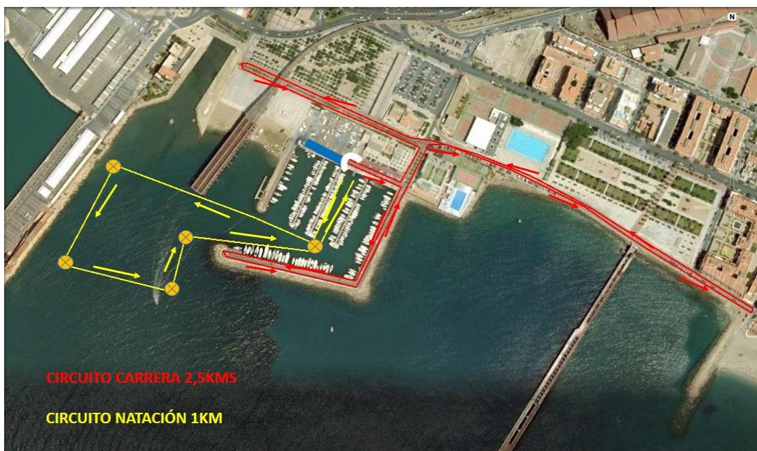
DETALLE CIRCUITOS I ACUATLÓN CIUDAD DE ALMERIA