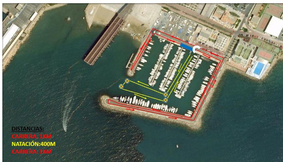
CIRCUITO CATEGORÍA INFANTIL