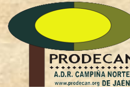
PRODECAN A.D.R. CAMPIÑA NORTE www.prodecan.org DE JAEN