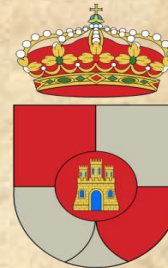
AYUNTAMIENTO VILLANUEVA DE LA REINA

El Ayuntamiento de Villanueva de la Reina pondrá a disposición de los duatletas servicios de lavado a presión para bicis y guardarropa junto a la zona de transición, así como un servicio de duchas ubicado en el Polideportivo Municipal (para una mejor localización de este lugar, usar las coordenadas GPS 38.002841, -3.9171490).